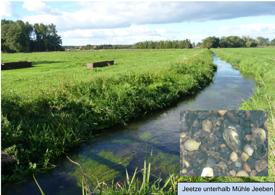
Jeetze unterhalb Mühle Jeeben